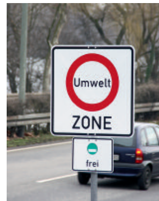
Umweltzone: Zeichen 270.1 und Zusatzzeichen 1031

In Umweltzonen dürfen nur noch Kfz am Verkehr teilnehmen, die mit einer Umweltplakette gekennzeichnet sind. Von diesen Verkehrsverboten ausgenommen, auch wenn sie nicht mit einer Plakette gekennzeichnet wurden, sind u. a. Kraftfahrzeuge für medizinische Betreuung oder den Transport von Behinderten (mit Eintrag „aG“, „H“ oder „Bl“ im Schwerbehindertenausweis), Motorräder und Oldtimer.