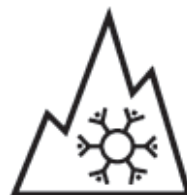
Alpine-Symbol (Bergpiktogramm mit Schneeflocke)

Für einspurige Kraftfahrzeuge, also Motorräder, Mofas, Motorroller, gilt keine „Winterreifenpflicht“.