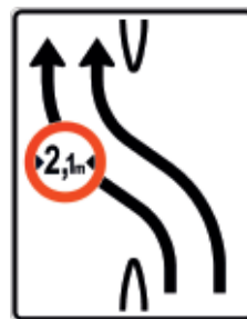
Überleitungstafel mit Zeichen 264

In zahlreichen Autobahnbaustellen sind die Überholfahrstreifen oft nur für Fahrzeuge mit einer Breite von maximal 2,10 Meter zugelassen. Dies wird durch Verkehrszeichen 264 (Verbot für Fahrzeuge über tatsächliche Breite einschließlich Ladung) auf der Lenkungsstafel angezeigt. Ein Problem, dass viele Autofahrer davon ausgehen, dass die Angaben in den Fahrzeugpapieren die Gesamtbreite des Autos angeben. Das ist nicht der Fall! Im Fahr-