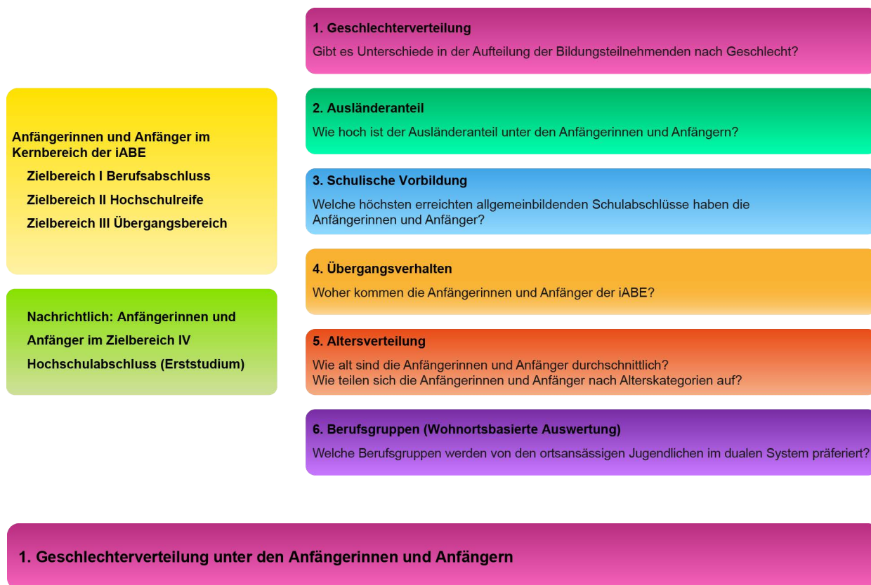
Abbildung 4 Zentrale Auswertungsmöglichkeiten der Anfängerzahlen

Durch die Berechnung einer Frauenquote , d. h. des Anteils der Frauen an allen Anfängerinnen und Anfängern im jeweiligen Einzelkonto, Teilbereich oder Zielbereich, können geschlechtsspezifische Disparitäten in einzelnen Bildungsgängen sichtbar gemacht werden.