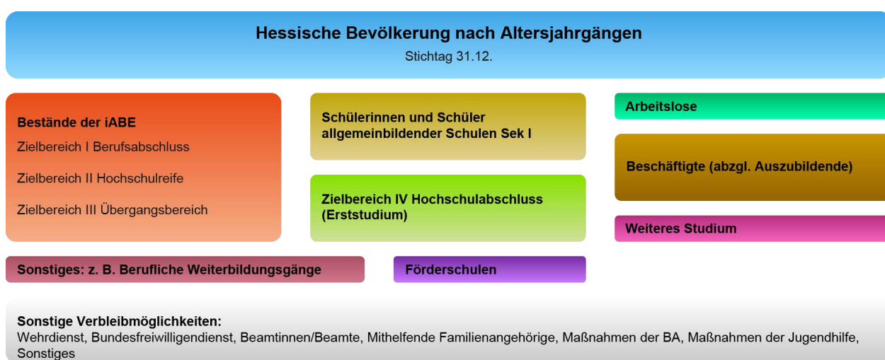
Abbildung 5 Verbleib einzelner Altersjahrgänge bezogen auf die hessische Bevölkerung

Um den Verbleib einzelner Altersjahrgänge vollständig zu untersuchen, müssen neben dem Ausbildungssystem noch weitere Verbleibsmöglichkeiten außerhalb der iABE, wie beispielsweise Beschäftigung und Arbeitslosigkeit, mit in die Analyse einbezogen werden. Dazu wird eine Kohortenbetrachtung erstellt. Eine Kohorte ist gleichzusetzen mit einem Geburtsjahrgang in der Bevölkerung (z.B. dem Jahrgang 2006). Die alternativen Verbleibsmöglichkeiten und die Bestände in den Zielbereichen der iABE werden auf die hessische Bevölkerung nach Geburtsjahrgängen bezogen, die hier als Referenzgröße dient. Darauf aufbauend werden Zahlen zu unterschiedlichen Verbleibszuständen (siehe Abbildung 5) abgebildet.