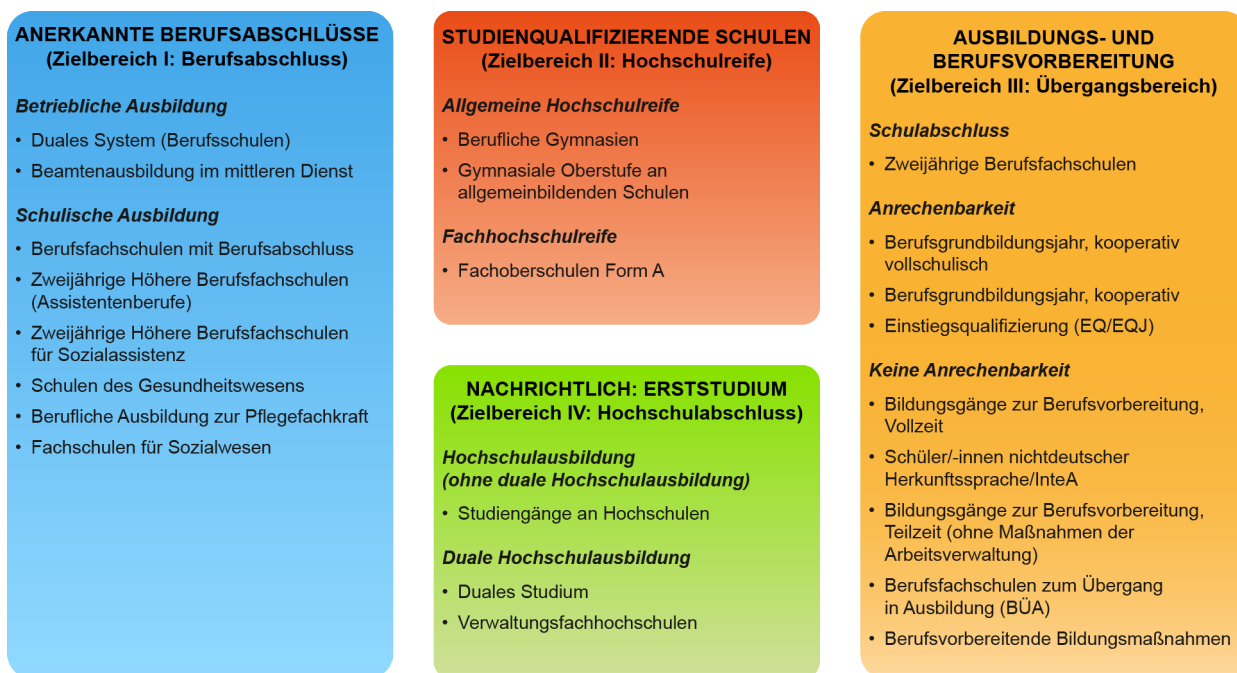
Abbildung 1 Zielbereiche, Teilbereiche und Einzelkonten der iABE